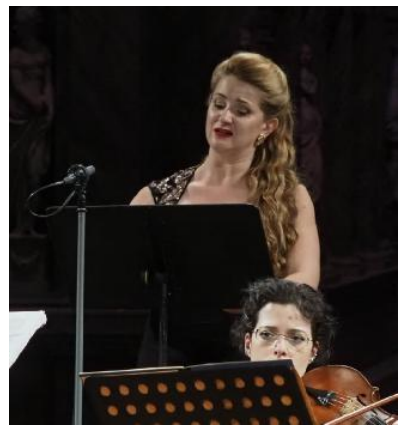
Soprano Yuliya Pogrebnyak