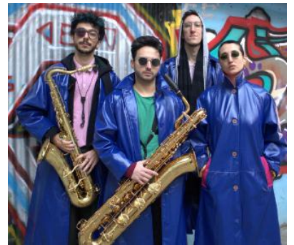
Live Il quartetto Moi Gea