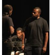
Jitney Una scena

Cos'era un jitney? Un servizio di trasporto "alternativo" nato negli Anni '50 per servire i quartieri più problematici di un nordamerica dalle forti tensioni razziali e dal degrado e povertà imperanti. I jitney operavano abusivamente fornendo alla comunità più disagiata un servizio fondamentale in zone difficili e mal servite da taxi e autobus. Wilson ambienta la sua opera all'interno di una stazione di jitney nell'anno 1977 a "The Hills", il quartiere della sua città natale, Pittsburgh, abitata da neri, ebrei e italiani. I