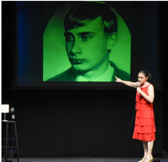
"Stupida show" Tra le immagini dello spettacolo anche quella di un giovanissimo Putin

Una volta preso atto del meccanismo, ci si può concentrare sulla bravura dell'attrice e sul suo saper stare sul palco da sola, ammiccando con le donne (e ogni tanto anche con gli uomini) in platea e mettendosi a nudo con coraggio e senza infingimenti.