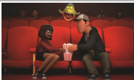
Una scena del film "Tropico cattivi"

LUX Via Matteotti, 21 - 0424/462279 www.cinemaluxasiago.it Sonic 2 - Il film di Jeff Fowler con James Marsden, Ben Schwartz. Animazione 20.45 Bassano del Grappa SALA DA PONTE E MARTINOVICH Piazzale Cadorna, 34/A - 0424/529477 Riposo Camisano Vicentino CINEMA TEATRO LUX Via Marconi, 20 - 0444/411411 www.luxcinema.it Corro da te di Riccardo Milani con Pierfrancesco Favino, Miriam Leone. Commedia 21.00 Dueville BUSNELLI Via Dante, 30 - 0444/040716 - 345/7079215 Lonigo CINECIAM Via C. Battisti, 116 - 0444/831063 www.cinecentrum.it/lonigo/